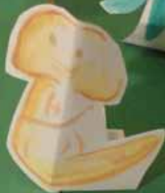
Écrivain : Red I Illustratrice: Noctie